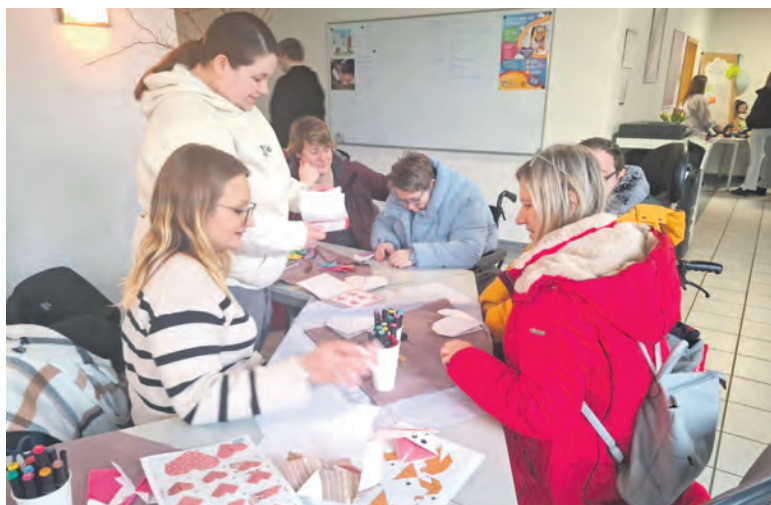
Am Tag der offenen Tür präsentierten Schülerinnen und Schüler an verschiedenen Stationen spannende Einblicke in die pädagogische Arbeit.