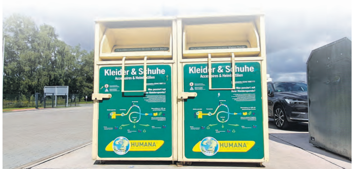
Container zur Abgabe von gebrauchsfähigen Alttextilien stehen auf den Wertstoffhöfen bereit

Altkleider werden vor allem zu einem Zweck gesammelt: Sie sollen weitergetragen werden. Deshalb sollten nur Textilien abgegeben werden, die sauber, trocken und gut erhalten sind. Kaputte oder stark verschmutzte Kleidung gehört weiterhin in die Hausmülltonne.