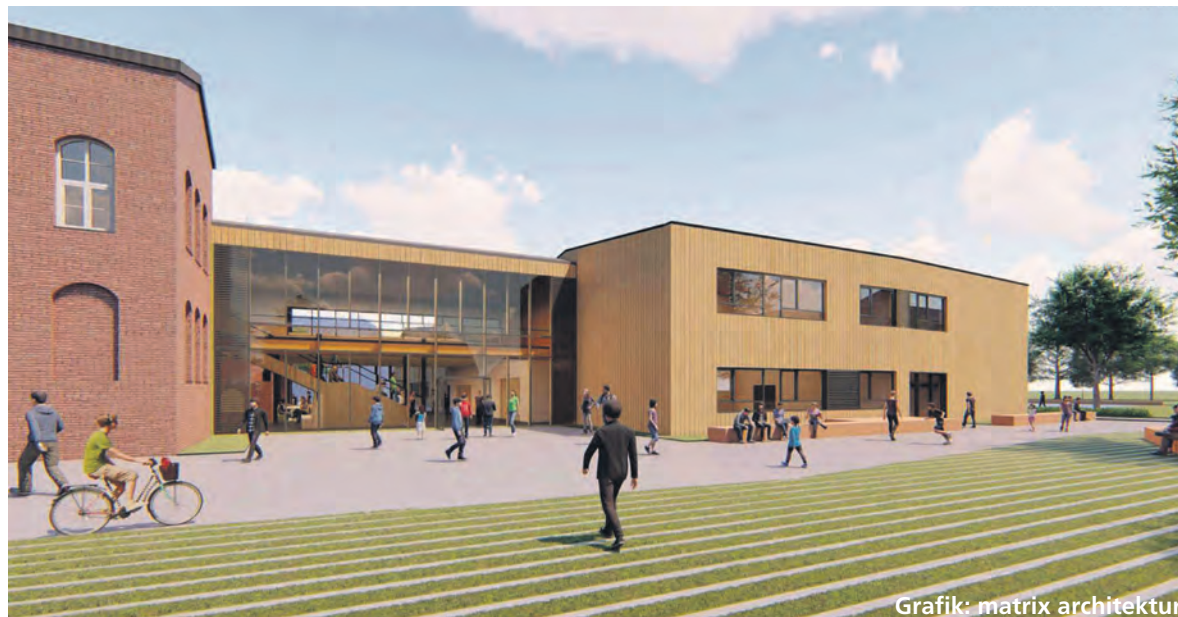
Grafik: matrix architektur